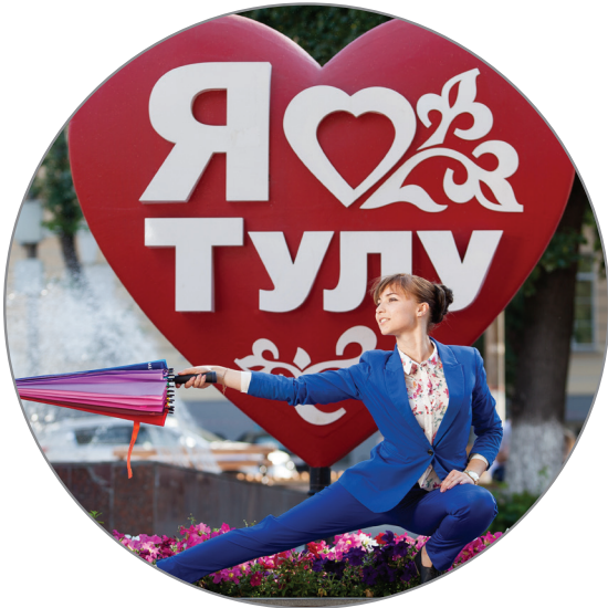
Тула 28 000 экз.