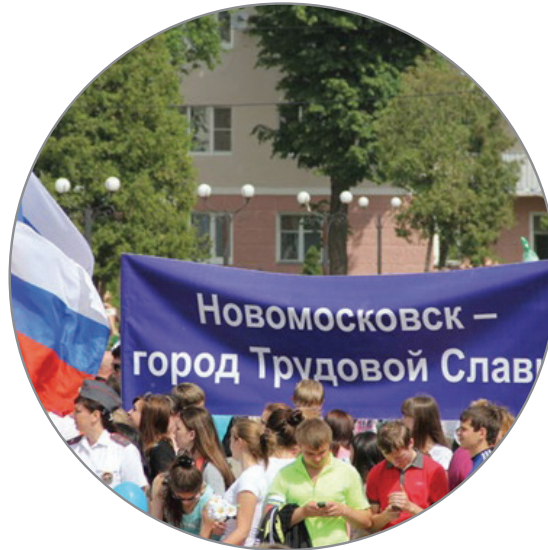
Тульская область 7 000 экз.