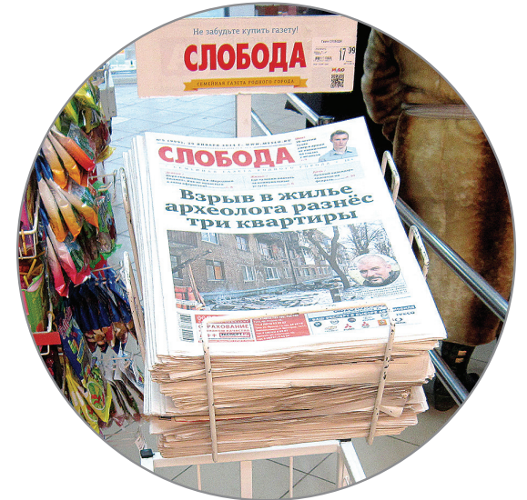
Супермаркеты 23 000 экз.