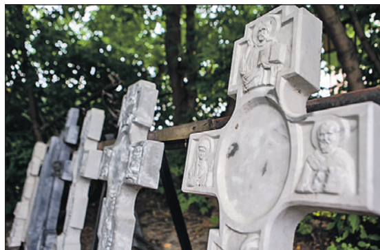
Ритуальная служба «ПАМЯТЬ» возьмет на себя все хлопоты.