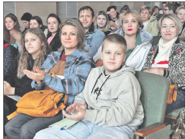
Родители и младшие братья и сестры всегда поддерживают своих родных, которые совсем скоро станут абитуриентами.

Татьяна Крикунова.