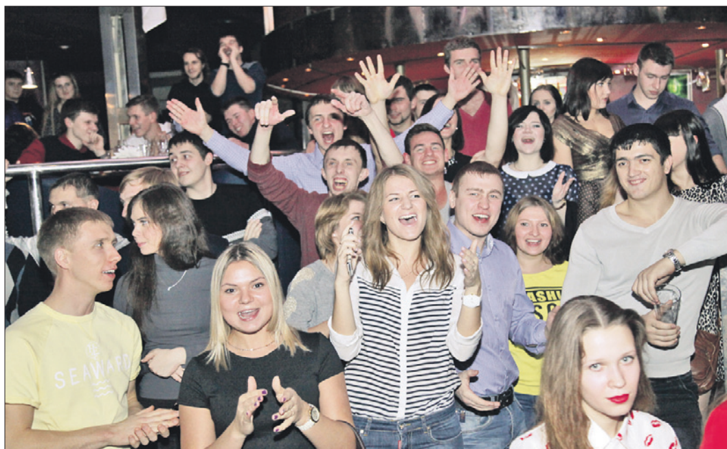
Одно время клуб превратился в театр, а вечеринки – в музыкальный клубный перформанс. Посетители были в восторге!

На вечеринках и концертах клуб вмещал до 1500 человек, поэтому он занимал первые позиции в «ночной жизни» города.