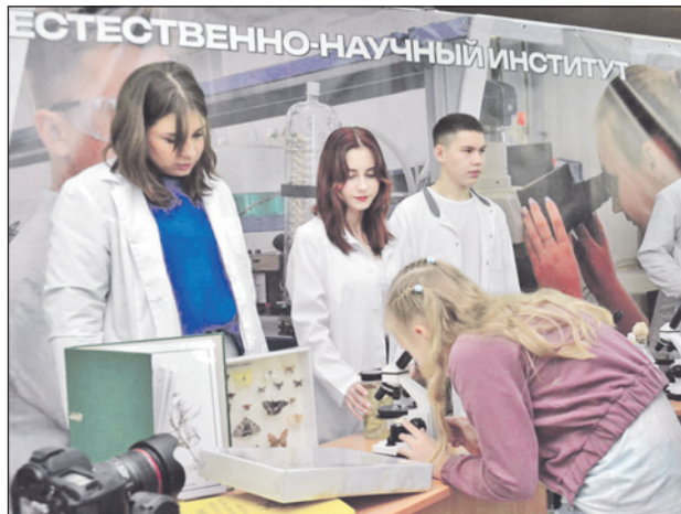
День открытых дверей в ТулГУ — это всегда интеллектуально-развлекательный праздник.