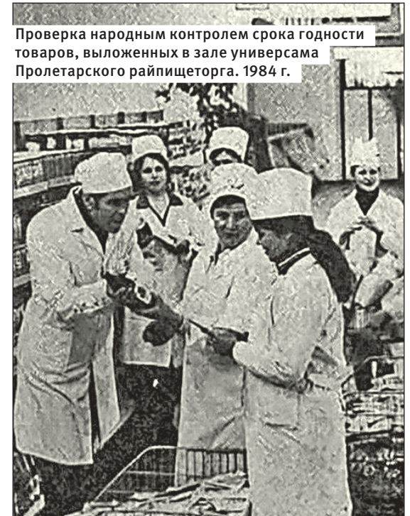
Проверка народным контролем срока годности товаров, выложенных в зале универсама Пролетарского райпищеторга. 1984 г.

Товар нужно было именно взвесить – фасованных продуктов практически не было. Поэтому сахар надо было взвесить на весах в кулечке. Ровно килограмм никогда не получался, всегда чуть больше. Хотя, согласимся, заплатить ровно за столько, сколько взял, все же лучше, чем приобрести вроде бы недорогой пакет сахара, а уже дома обнаружить, что в нем не килограмм, а 800 граммов. В те же бумажные кулечки насыпались рис, гречка, конфеты, макароны. Не нынешние спагет-