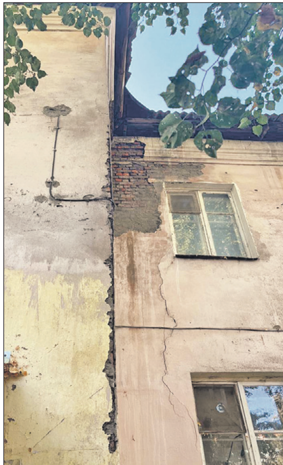
Больше всего жителей беспокоит, что в разваливающемся доме живут семьи с маленькими детьми.