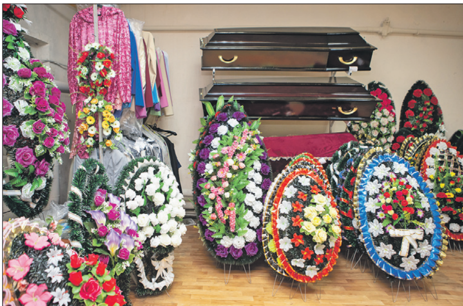
В ритуальной службе «ПАМЯТЬ» есть производство ритуальной атрибутики.