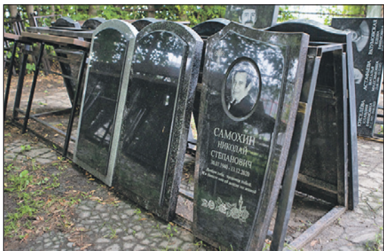
Цены на памятники позволяют сдерживать прямые поставки из Карелии и собственное производство.