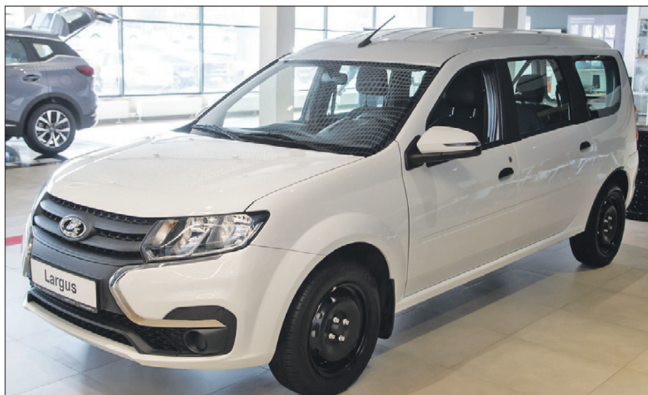
LADA Largus – настоящая легенда. Надежный и вместительный автомобиль выбирают для городских поездок и путешествий всей семьей.