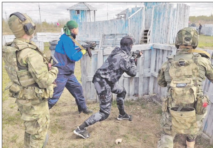
Региональная система допризывной подготовки молодежи Тульской области позволяет охватить 100% юношей, допущенных к участию в учебных сборах. В 2024 году учебные сборы пройдет более 3500 ребят.

Программа учебных сборов включает проведение теоретических и практических занятий по огневой, тактической, строевой, военно-медицинской и физической подготовке, радиационной, химической, биологической защите