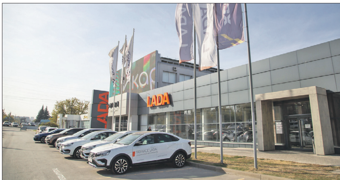
LADA Largus покупают в Туле на ул. Рязанской, 7 у официального дилера «Корс Групп». Уехать на новой машине можно уже в день покупки.