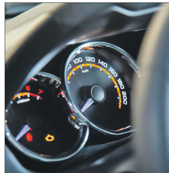
В легендарном автомобиле есть всё для удобства водителя и пассажиров.