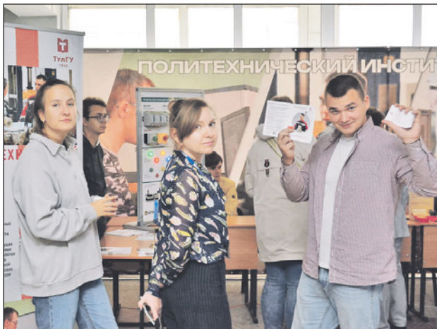
Ребята определились со своими будущими профессиями и факультетами, где хотят учиться.