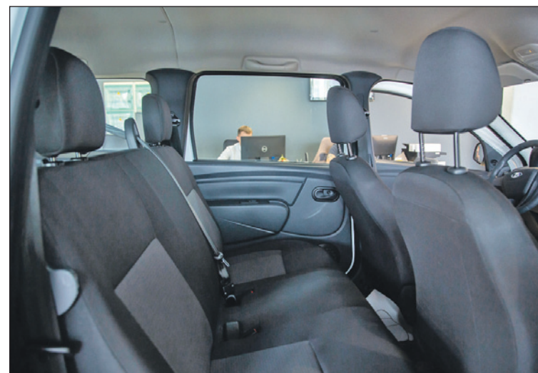
Просторный салон позволяет с комфортом разместить всех членов семьи.