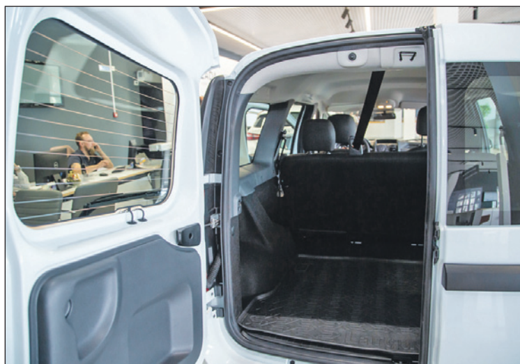
Вместительный багажник – одно из главных достоинств модели. Возьмите с собой всё что хотите!