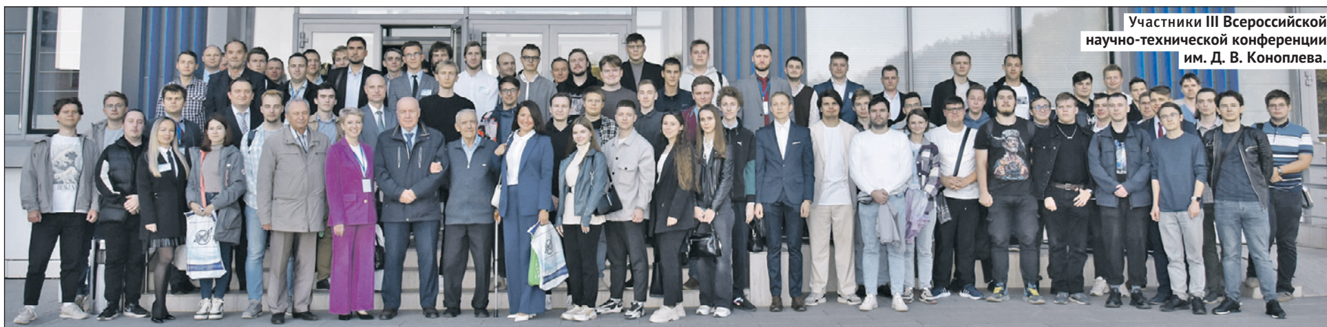
Участники III Всероссийской научно-технической конференции им. Д. В. Коноплева.

Можно с уверенностью сказать, что Всероссийская научно-техническая конференция им. Д. В. Коноплева становится площадкой для обмена мнениями, местом, где опыт встречается с молодостью и где в спорах рождаются новые решения.