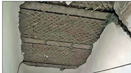
В дыре на потолке в подъезде в дождливую погоду скапливается вода, зимой она замерзает.