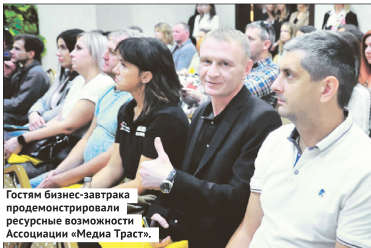
Гостям бизнес-завтрака продемонстрировали ресурсные возможности Ассоциации «Медиа Траст».