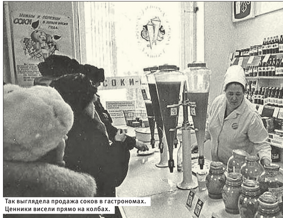
Так выглядела продажа соков в гастрономах. Ценники висели прямо на колбах.

Также имелись в наличии: березовый сок за 11 копеек, яблочный с мякотью за 12 – но это на любителя, и яблочный осветленный. Сливовый всегда был с мякотью, но вкусный. Иногда