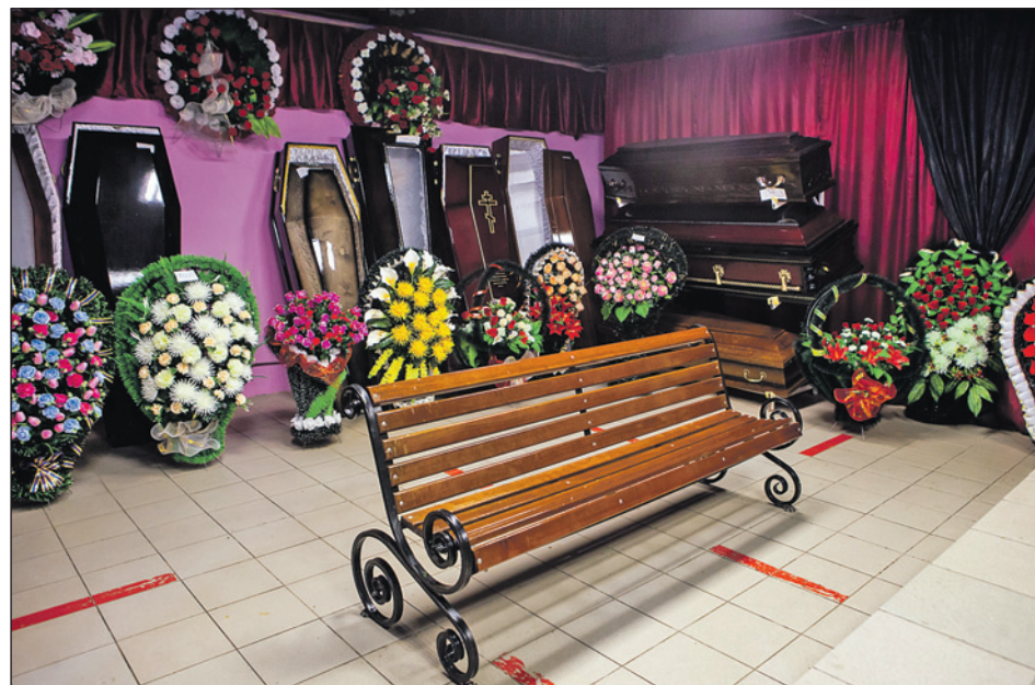
У ритуальной службы «ПАМЯТЬ» есть собственный траурный зал.