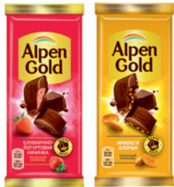
ОБЫЧНАЯ ЦЕНА 119.99 *ЦЕНА 1шт ПРИ ПОКУПКЕ 2шт ПО КАРТЕ

ШОКОЛАД «Альпен Голд» в ассортименте 85гр/90гр