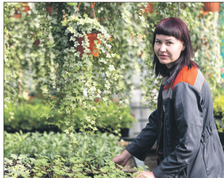
Струющиеся ампельные растения органично впишутся в интерьер веранды или беседки.