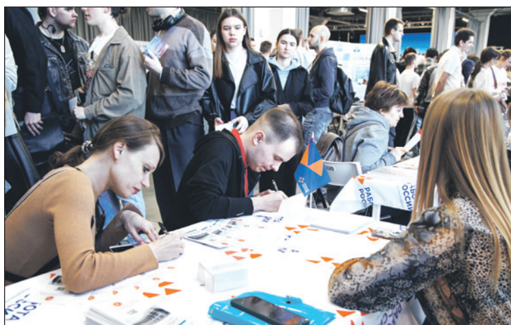
На ярмарке развернулась нешуточная конкуренция среди работодателей за будущих сотрудников.

– Сейчас нам важно повысить производительность тру-