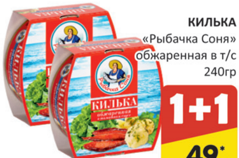
ОБЫЧНАЯ ЦЕНА 99.99 *ЦЕНА 1шт ПРИ ПОКУПКЕ 2шт ПО КАРТЕ