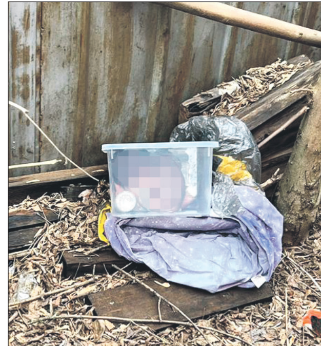
Младенцу, обнаруженному на улице Сурикова, было от двух недель до месяца.