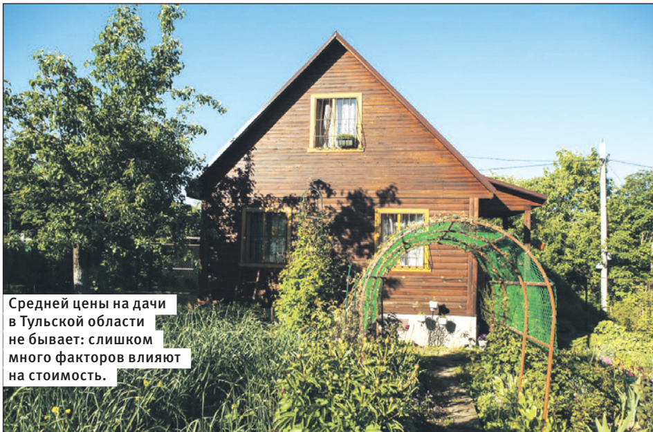
Средней цены на дачи в Тульской области не бывает: слишком много факторов влияют на стоимость.