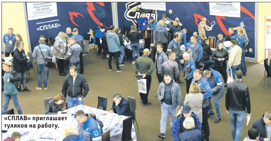
«СПЛАВ» приглашает туляков на работу.