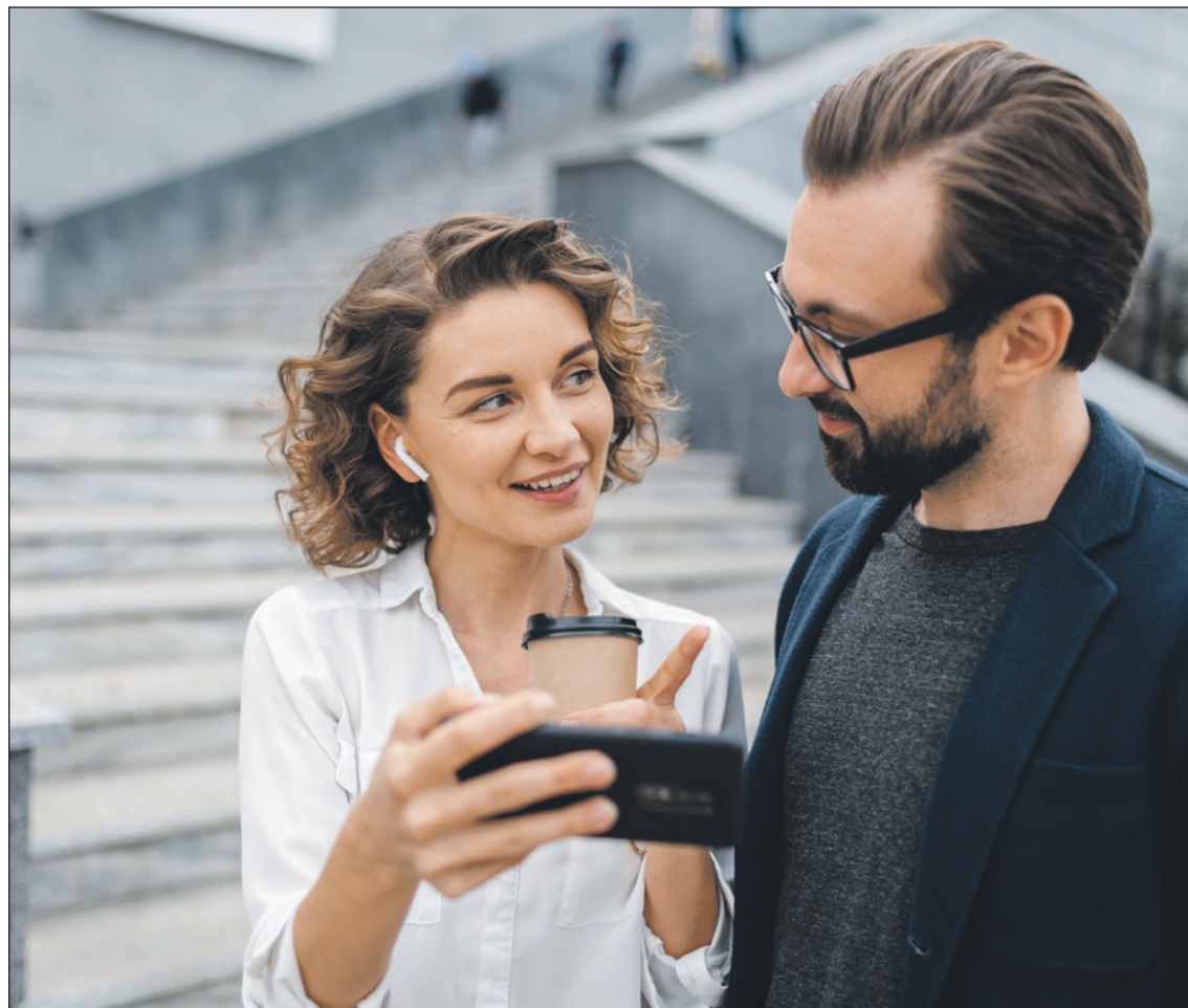
Чтобы найти пару, нужно знакомиться. Чем больше вариантов – тем больше шансов.