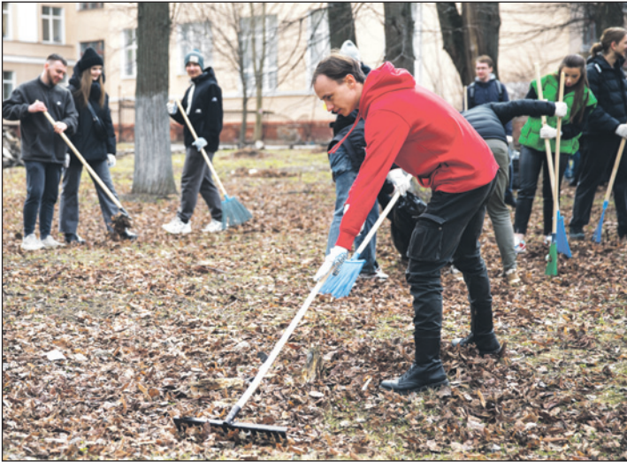
13 апреля 2024 года. Субботник в студгородке ТулГУ. А всего в субботнике приняли участие более 22 тысяч туляков.