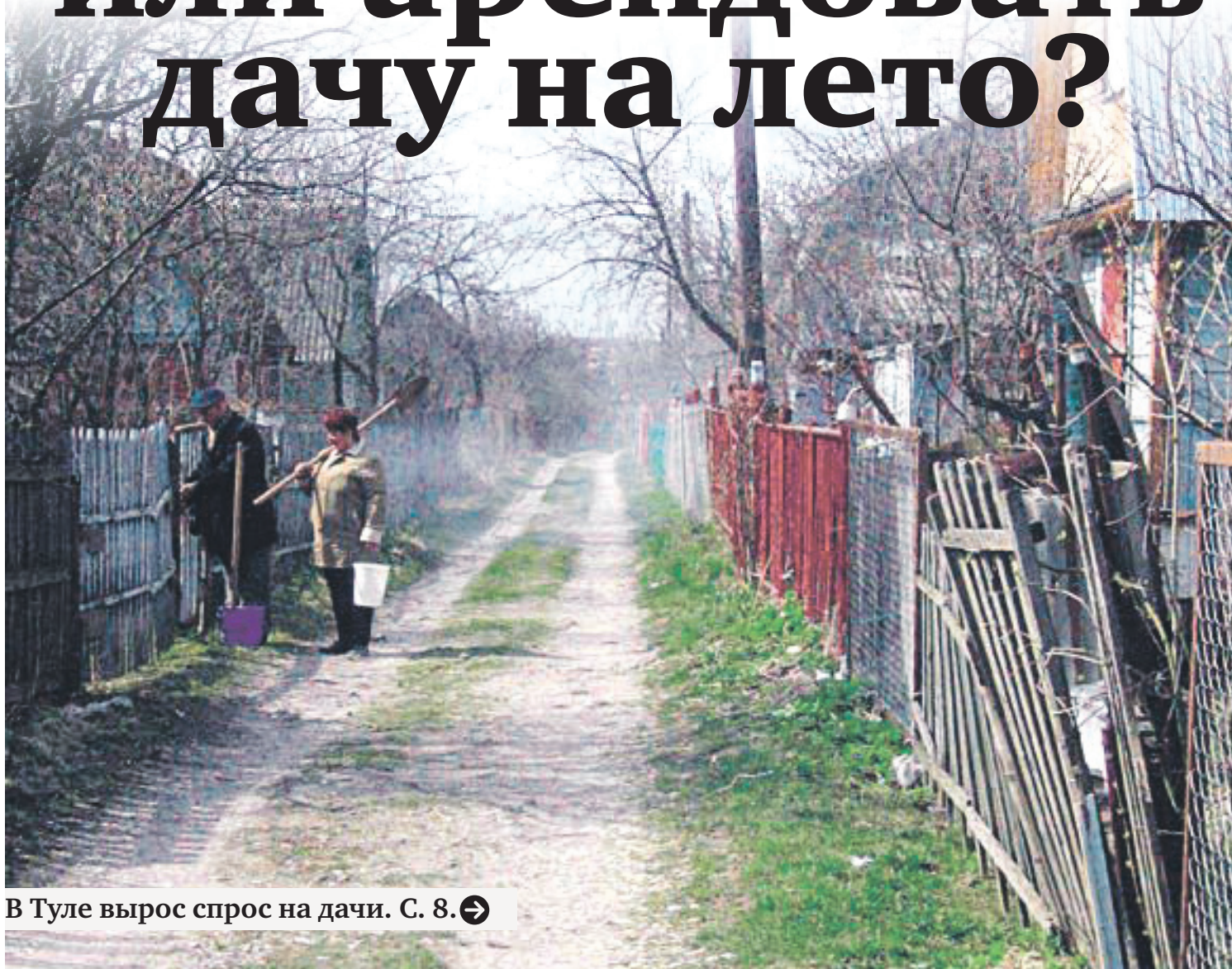
В Туле вырос спрос на дачи. С. 8. ➔