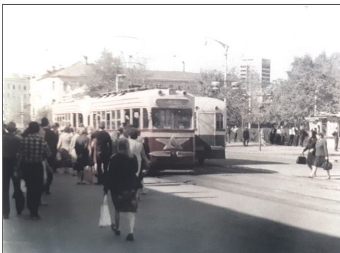
Остановка «Детский универмаг».