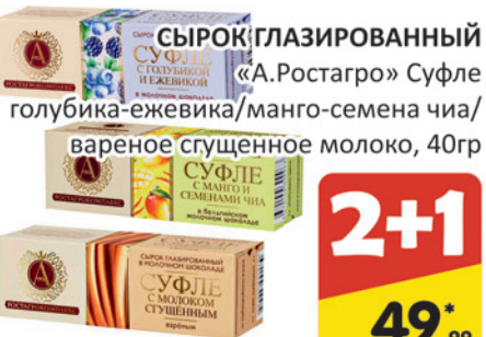
ОБЫЧНАЯ ЦЕНА 74.99 *ЦЕНА 1шт ПРИ ПОКУПКЕ 3шт ПО КАРТЕ