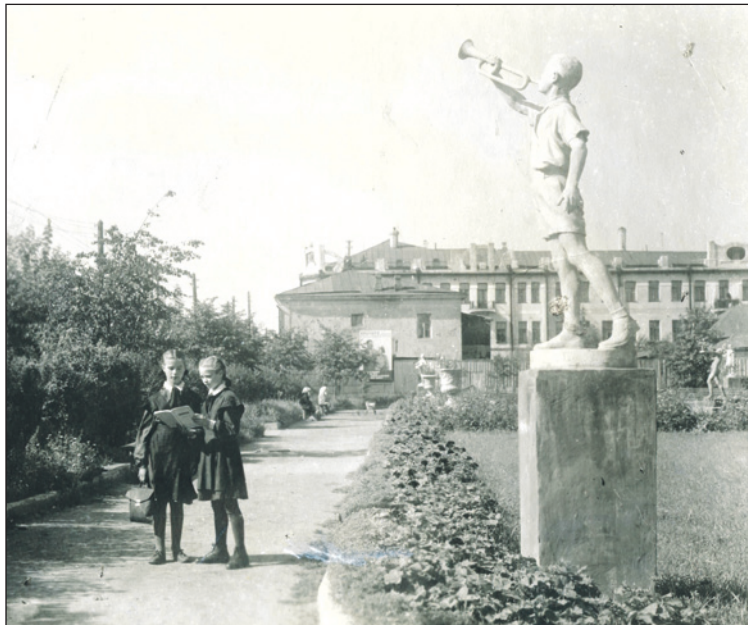
Гипсовые скульптуры в Пионерском сквере.

Закружи же церковь под мифическую идею выполнения «неоднократных наказов рабочих о переносе центральной