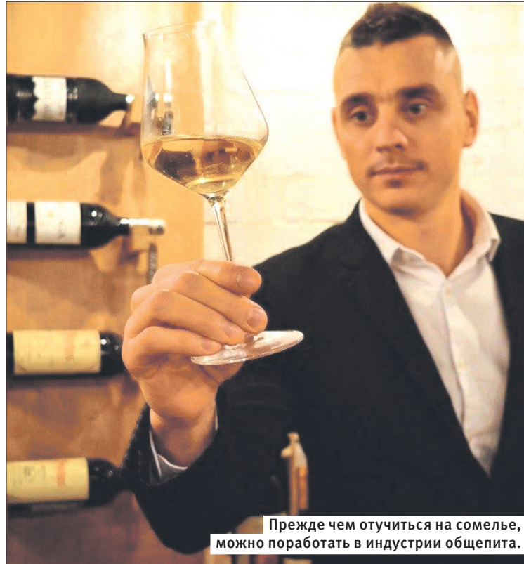
Прежде чем отучиться на сомелье, можно поработать в индустрии общепита.

– В аромате вина не должно быть ничего постороннего: белые или красные фрукты (в зависимости от вина), специи, травы, цветы, сдоба, иногда овощи. Ароматы могут быть специфичными, но должны быть