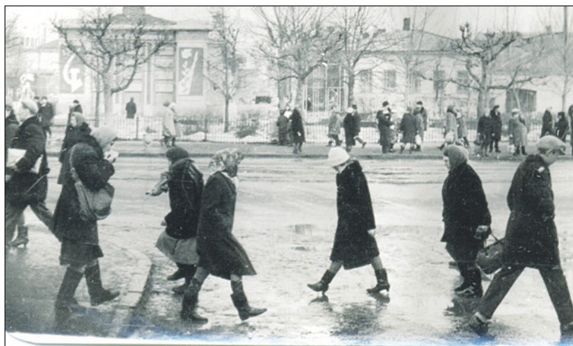
Улица Советская. Вид на Пионерский сквер.

«болгарского Ленина» Георгия Димитрова. В то время он был известен в Советском Союзе по сфабрикованному делу о причастности к поджогу Рейхстага 27 февраля 1933 года. На Лейпцигском процессе в сентябре-декабре 1933 года Димитров доказал свою невиновность и был оправдан, да еще из обвиняемого стал обвинителем нацистов.