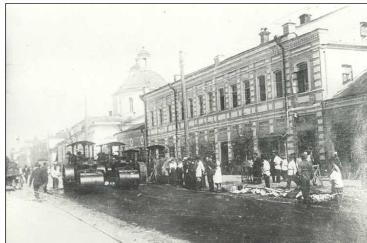
Асфальтирование Советской улицы. Спасо-Преображенский собор еще стоит.

здесь сквера. Еще один детский сквер планировали обустроить на улице Жуковской.