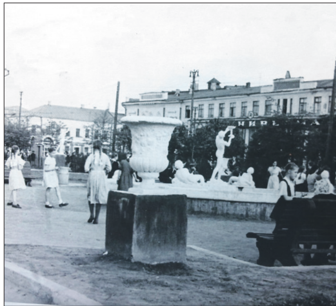
Праздник в Пионерском сквере. 1950-е годы.