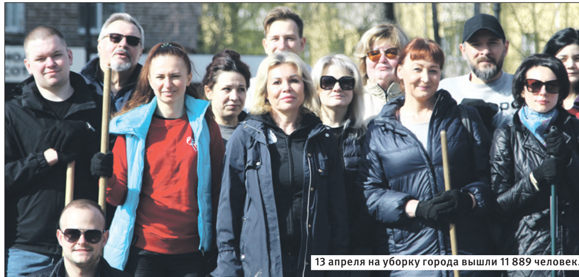
13 апреля на уборку города вышли 11 889 человек.

вым оборудованием. Всего на уборку города вышло 11 889 человек.