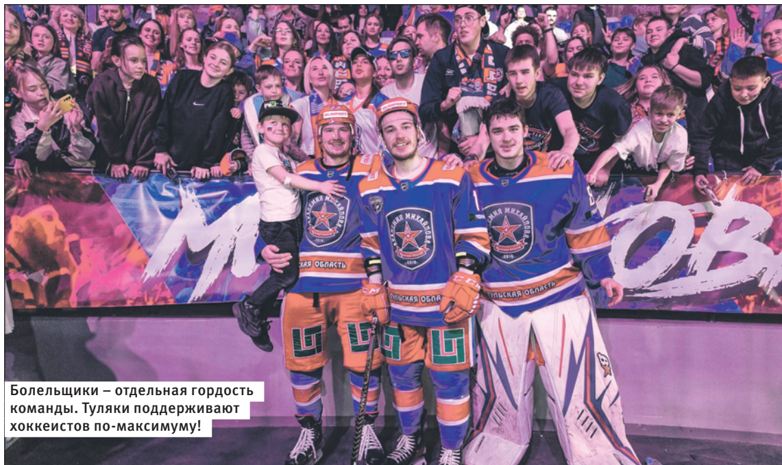
Болельщики – отдельная гордость команды. Туляки поддерживают хоккеистов по-максимуму!

Давайте заполним трибуны и поможем нашим ребятам! Они этого очень ждут и точно отблагодарят яркой и красивой игрой. Встретимся на матче!