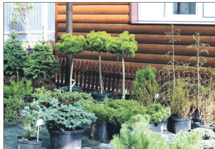
Декоративные деревья и кустарники станут изюминкой любого загородного участка.