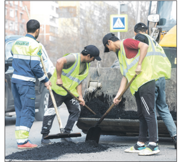
Ямочный ремонт в Тульской области будет закончен до 31 мая 2024 года.