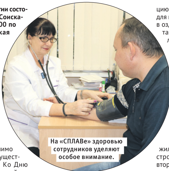
На «СПЛАВе» здоровью сотрудников уделяют особое внимание.

На территории НПО «СПЛАВ» работает здравпункт. В нем прово-