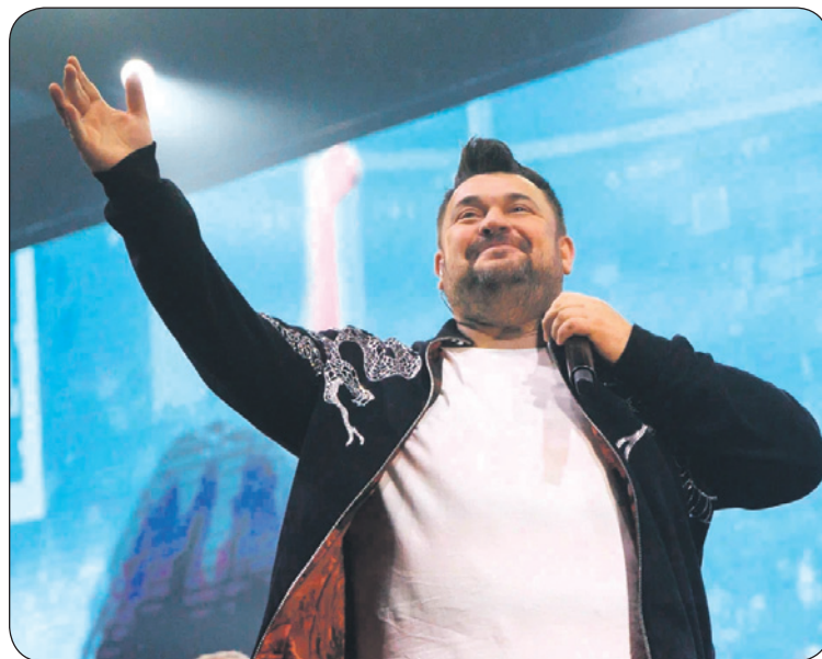
«Алёшка» или «Он тебя целует»? Неважно, главное – руки вверх!

«Маленькие девочки в первый раз влюбляются, маленькие девочки, каждый ошибается», – поёт Сергей Жуков. «Маленькие девочки, это не считается, маленькие девочки,