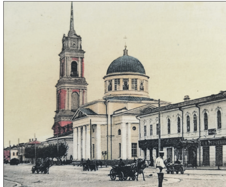
Спасский собор — один из самых величественных и любимых в Туле.

Спешно начали разборку церкви Воздвижения напротив уже построенного здания фабрики-кухни и обустройство