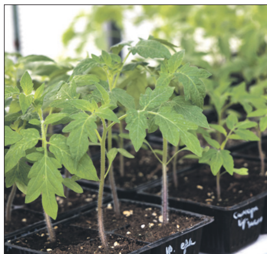
Только одних сортов помидоров несколько десятков! А еще есть баклажаны, арбузы и многое другое.