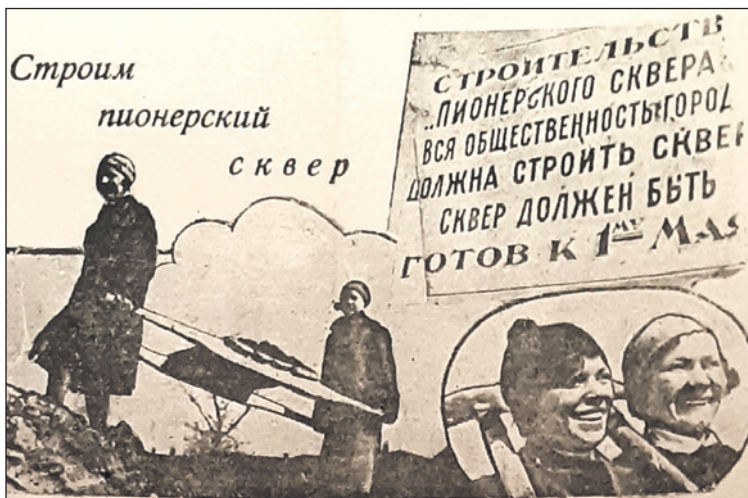
«Построим Пионерский сквер». Коллаж из газеты «Коммунар», 1934 г.

библиотеки с окраины города ближе к рабочим массам». Специальная комиссия удовлетворила просьбу разместить здесь центральную библиотеку. Для претворения идеи в жизнь определили смету в десять тысяч рублей, в которую входило устройство деревянных перегородок и дверей для создания ряда комнат, утепление помещения постройкой трех печей, снятие решеток, побелка и перетирка стен и потолков, а также другой мелкий ремонт.