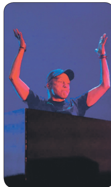
DJ Грив – главный сюрприз этого вечера.