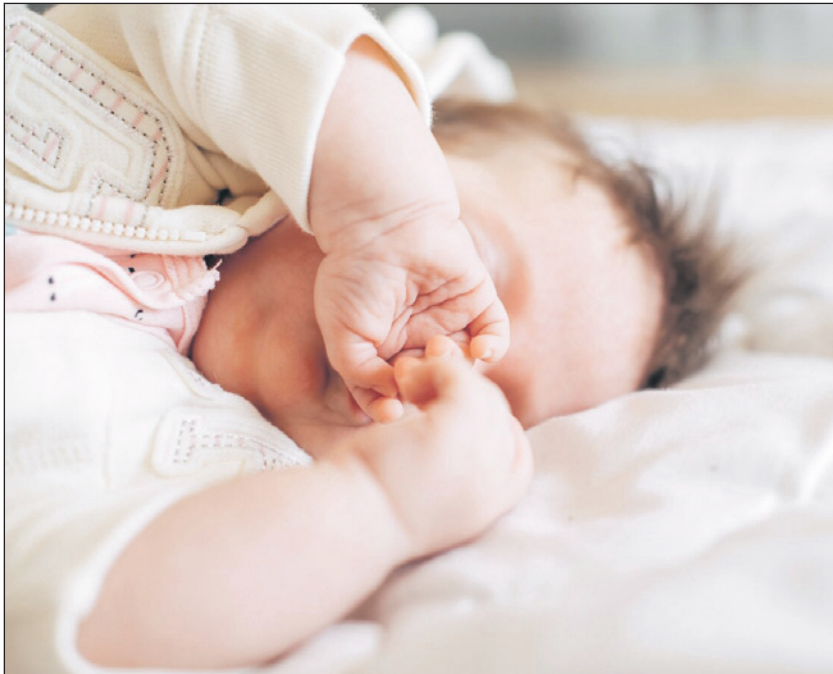
В России ежегодно фиксируется 26-27 случаев убийства новорожденного.

Трагедии на улице Сурикова можно было бы избежать, если бы мать ребенка вовремя обратилась к пси-