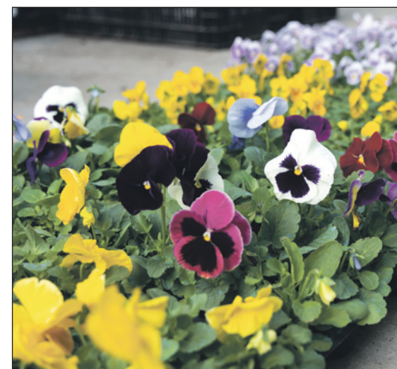
Бесконечная палитра оттенков виолы будет радовать своим пышным цветением весь сезон.