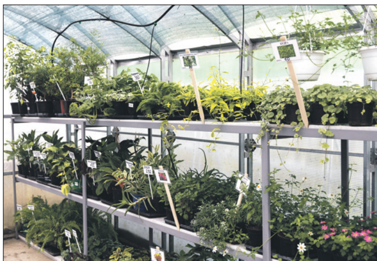
Комнатные растения по приемлемым ценам – это находка для тех, кто и в квартире хочет жить в окружении зелени.