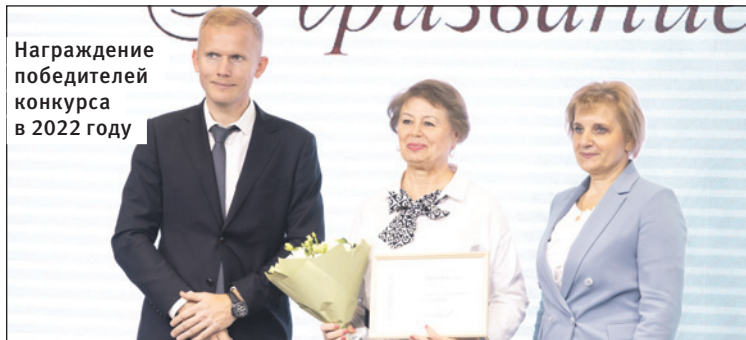
Награждение победителей конкурса в 2022 году

В номинациях «Педагог-наставник», «Новации и традиции» и «Профессиональный дебют» предусмотрено по девять