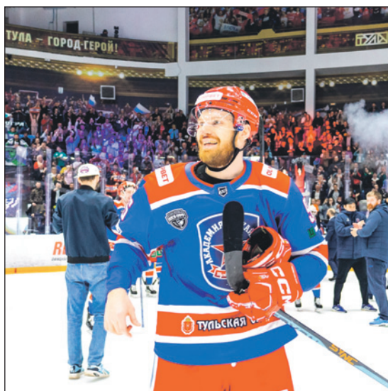
Выход в финал Кубка Петрова – историческое событие для АКМ.