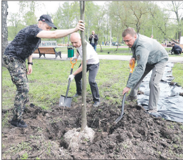
Май 2021 г. Баташи. Губернатор Алексей Дюмин личным примером вдохновлял туляков.