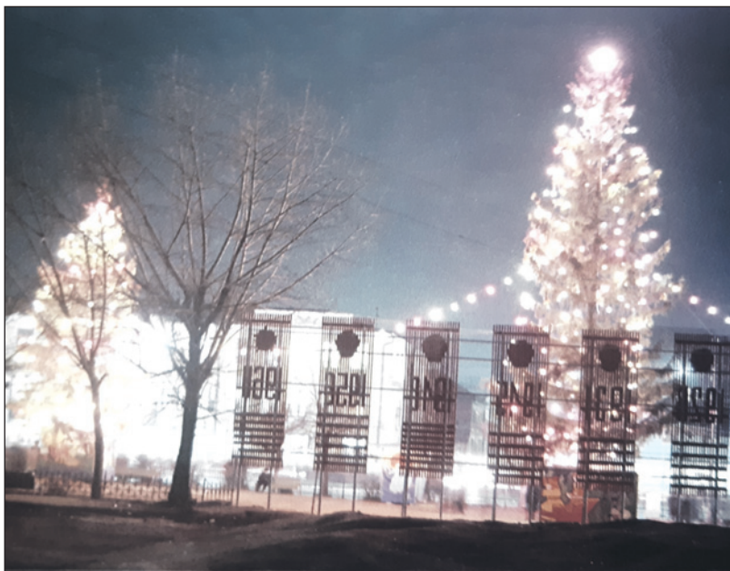
Елка в Пионерском сквере. 1972 г.