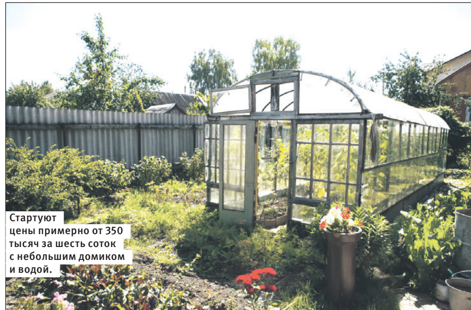
Стартуют цены примерно от 350 тысяч за шесть соток с небольшим домиком и водой.