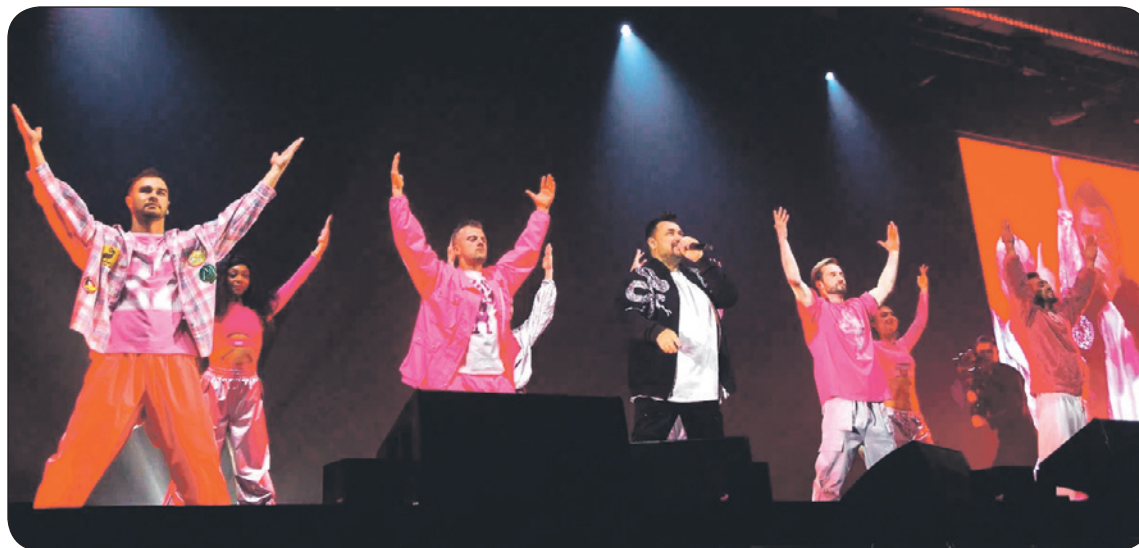
Свет, музыка, крутой танцевальный коллектив – вот что делает концерт классным!

вы такие маленькие», – слышится другой голос... Кто это?! На сцене появляется стильный молодой человек, подозрительно похожий на исполнителя.