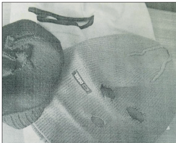
К делу преступники подошли основательно: соорудили маски, вооружились.