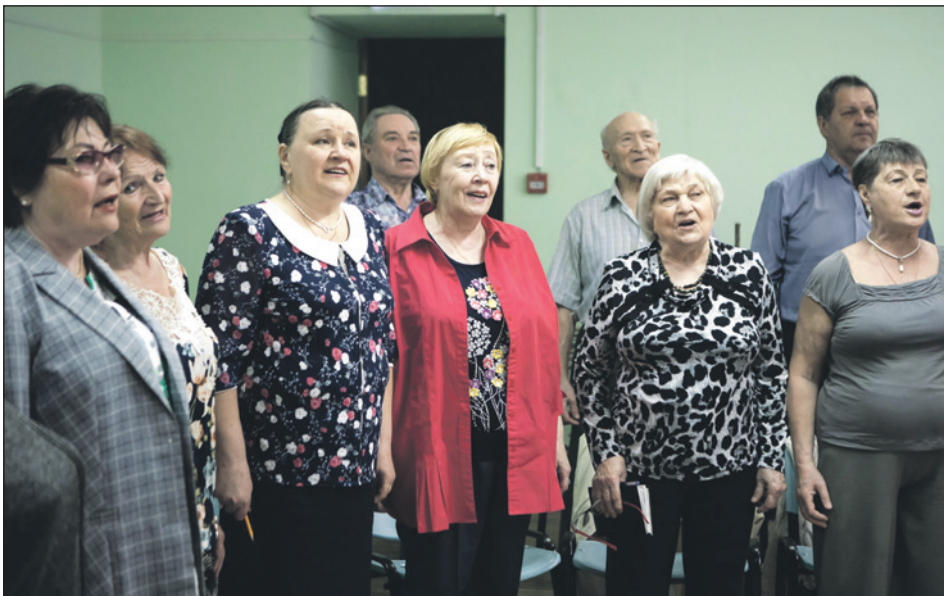
Дважды в неделю – как на работу: участники хора «Весновой» рады собраться большой дружной семьёй!