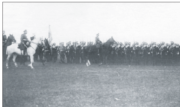
Император Николай II объезжает строй Великолуцкого полка перед отправкой его на Дальний Восток.