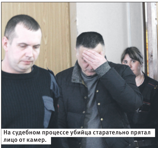
На судебном процессе убийца старательно прятал лицо от камер.