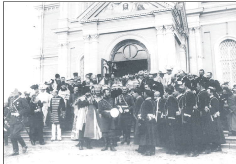
Император у входа в зимний собор кремля. 1904 г.

Но остановились на Ново-Дворянской, которую переименовали в Николаевскую. Исходили из той логики, чтобы одновременно переименовать Старо-Дворянскую в просто Дворянскую. Улица Николаевская просуществовала ровно до свержения самодержавия. Сразу после Февральской революции ее переименовали в улицу Свободы.