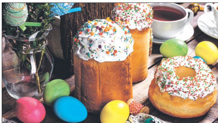
Пасха – один из самых вкусных праздников!

Цены на яйца (будто специально к светлему празднику) снизились. Об этом рассказывает Георгий Ткаченко , заместитель руководителя птицефабрики «Тульская»: