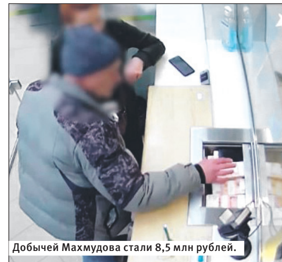
Добычей Махмудова стали 8,5 млн рублей.