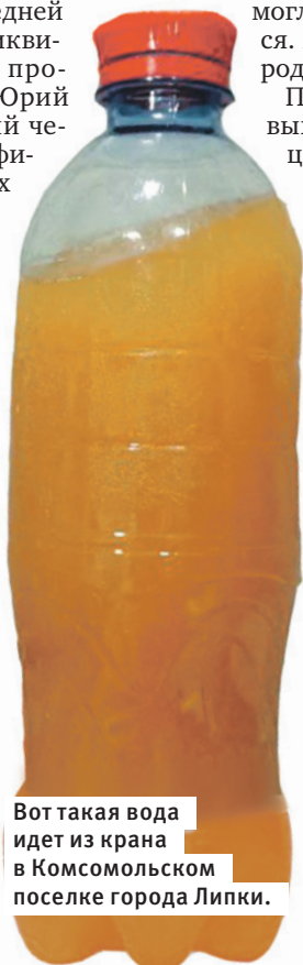
Вот такая вода идет из крана в Комсомольском поселке города Липки.

В целях улучшения качества водоснабжения в г. Липки за период 2020-2023 гг. направлено 12,37 млн руб., в том числе из областного бюджета – 11,67 млн руб. Проведены работы по замене 3,7 км ветхих водопроводных сетей и ремонт фильтров водозабора Северный. В 2022 году за счет бюджета МО г. Липки на водозаборе Северный также были проведены работы по замене участка трубопровода от 2 артезианских скважин с заменой запорной арматуры.