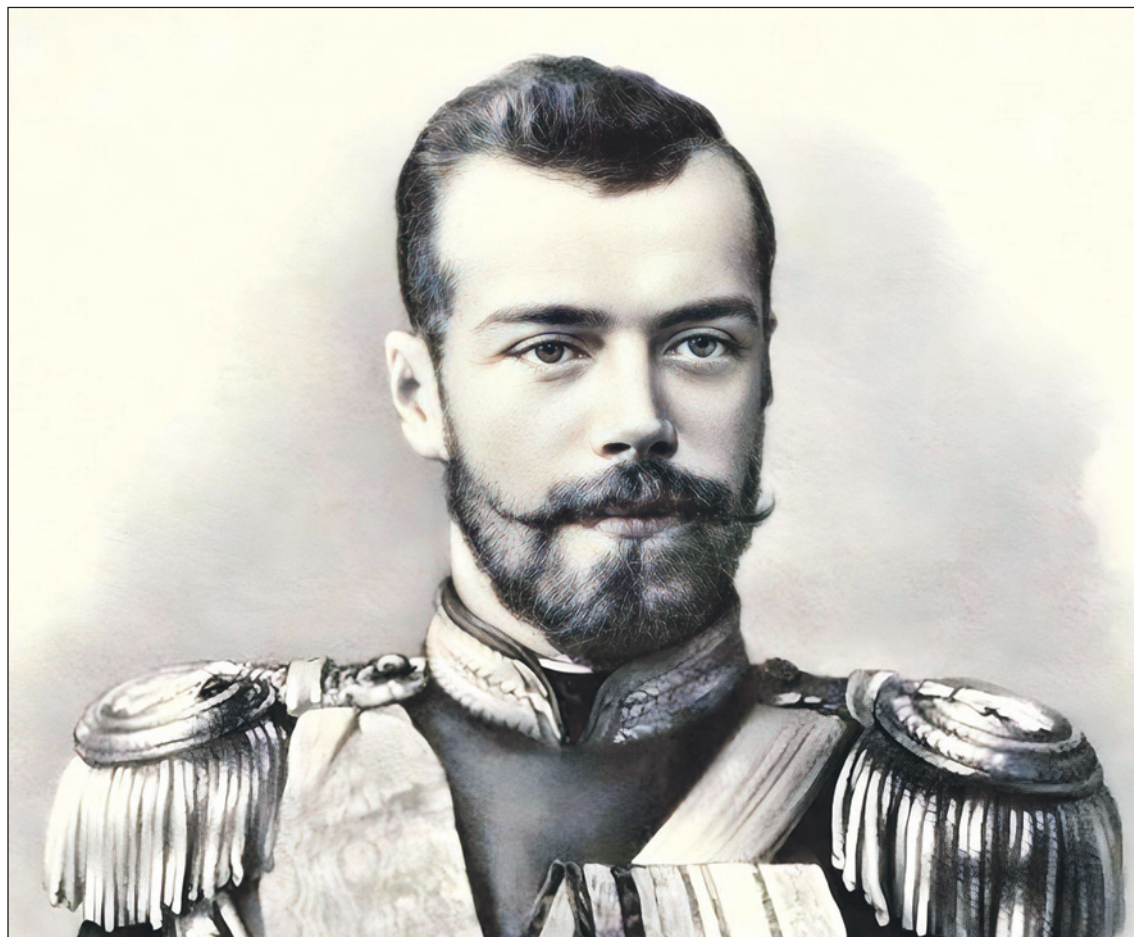
Император Николай II.

29 апреля (11 мая) 1891 года в японском городе Отсу будущий российский император Николай II вместе с двумя принцами – греческим Георгом и японским Арисугавой – возвращался в Киото после посещения озера Бива. Неожиданно на него бросился стоявший в оцеплении нижний полицейский чин