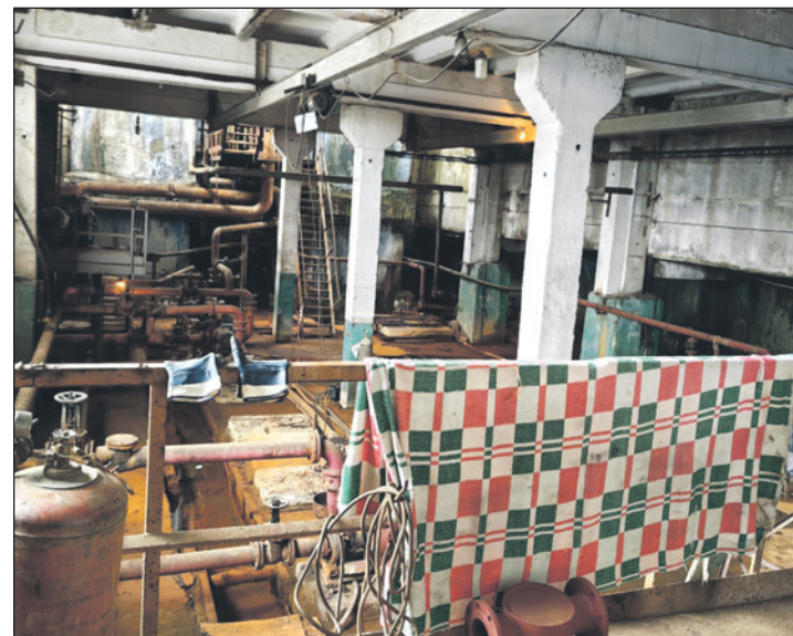
На водозабор в Липках может зайти любой желающий.