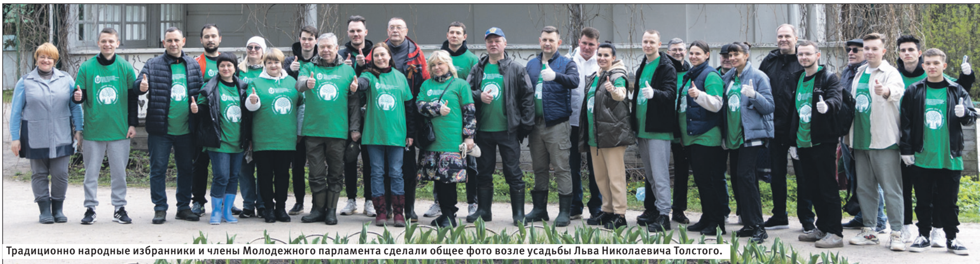
Традиционно народные избранники и члены Молодежного парламента сделали общее фото возле усадьбы Льва Николаевича Толстого.