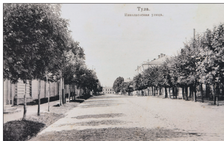
В 1904 г. в Туле появилась Николаевская улица, которая потом стала улицей Свободы.