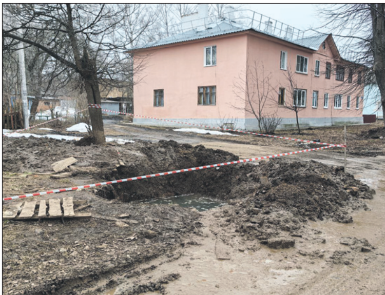
Город Липки. очередной прорыв ветхой трубы.