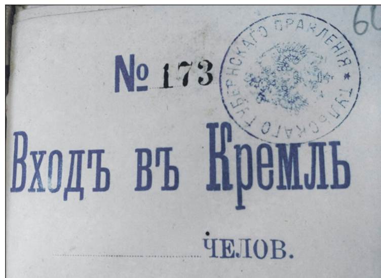
Билет для входа в кремль во время высочайшего визита.