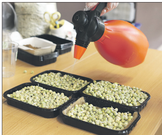
Сажаем, поливаем и ждем. Через 10-12 дней уже можно снимать урожай ароматного горошка.

– Кокосовую стружку я перемешиваю с перлитом (натуральный материал вулканического происхождения – горная порода. – Прим. авт.) и добавляю немного торфа. Размер лоточков примерно 10 на 20 см. Перед посадкой горох должен сутки постоять в воде и затем сутки «подышать». Вот тогда и появляются маленькие росточки. Засыпаем горошек в лоточек и поливаем водой с разведенным в ней полезным питательным веществом. Затем лоточки ставим друг на друга и на 3-4 дня убираем в темное место на проращивание. Когда появятся ростки сантиметра в полтора, лотки можно выставлять на свет. 10 дней – и горошек можно срезать.