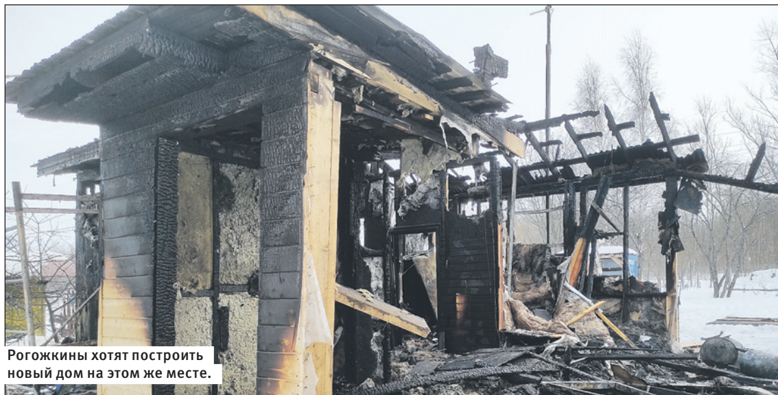
Рогожкины хотят построить новый дом на этом же месте.

Причину пожара устанавливают специалисты, пока еще нет никакого итога.