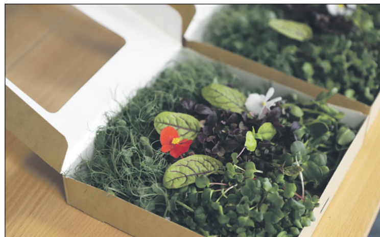
Зелень можно собирать в наборы и дарить! В этой коробочке горошек, редис, подсолнечник, базилик, щавель и цветки бегонии.