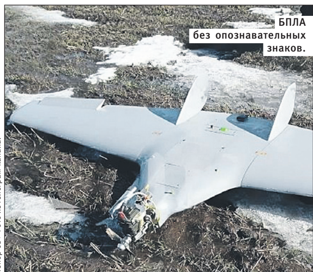
БПЛА без опознавательных знаков.

Карта Тинькофф: 2200 7007 5814 3605, к карте привязан номер телефона 8 (963) 711-79-90.