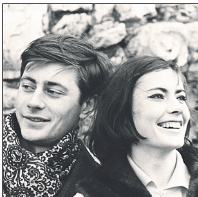
Валентин Смирнитский и Виктория Фёдоровая в фильме «Двое», 1965 г.

– Желаю сохранять хорошее оптимистичное настроение, не впадать в пессимизм и верить только в хорошее. Только тогда у человека есть желание работать, любить, создавать семьи. Не унывайте!