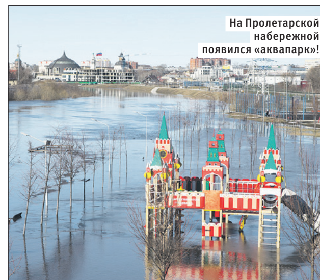
На Пролетарской набережной появился «аквапарк»!

Синоптики прогнозируют, что в конце марта ненадолго вернутся морозы – ожидается полярное вторжение с высокой вероятностью снежных зарядов.