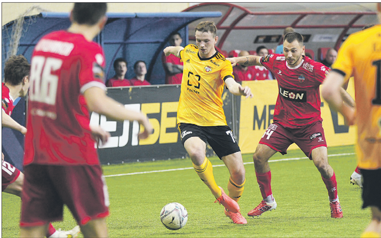
Последнюю победу в Первой лиге туляки одержали в ноябре прошлого года.

первые 15 минут второй половины встречи соперники получили 3 желтые карточки. Одна из них была показана запасному: защитник «Енисея» Херман Феррейра со скамейки громко раскритиковал одно из решений Машлякевича и получил заслуженный «горчичник».