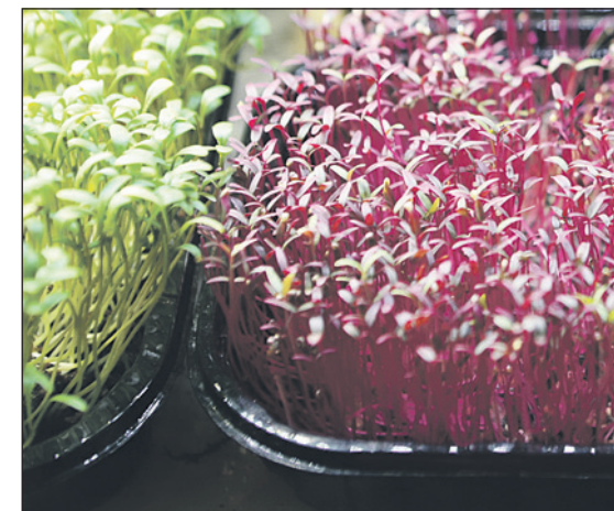
Красный амарант имеет вкус орешков. Им любят украшать суши, идеально сочетается с икрой.