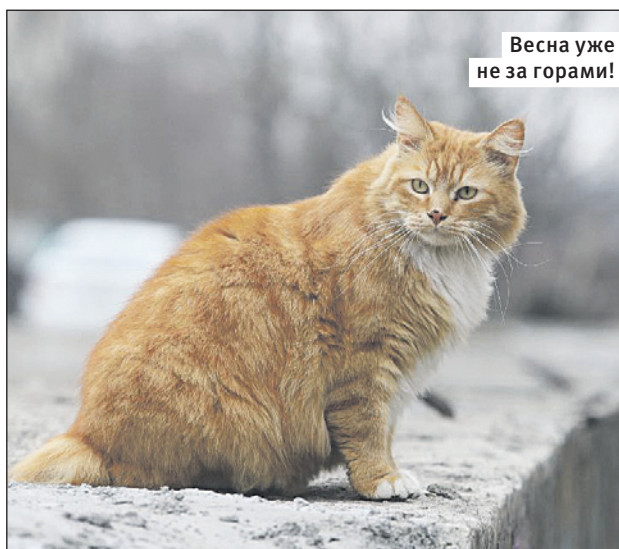
Весна уже не за горами!

В комитете Тульской области по региональной безопасности сообщили, что угрозы безопасности населению и инфраструктуре нет. На месте происшествия работали оперативные службы.