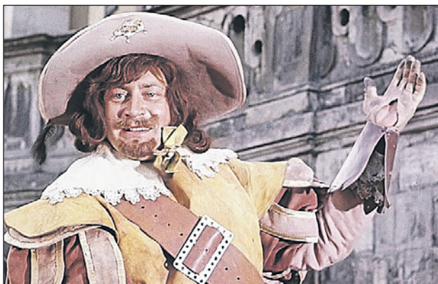
Обаятельный Портос из фильма «Д'Артаньян и три мушкетёра», 1979 г.