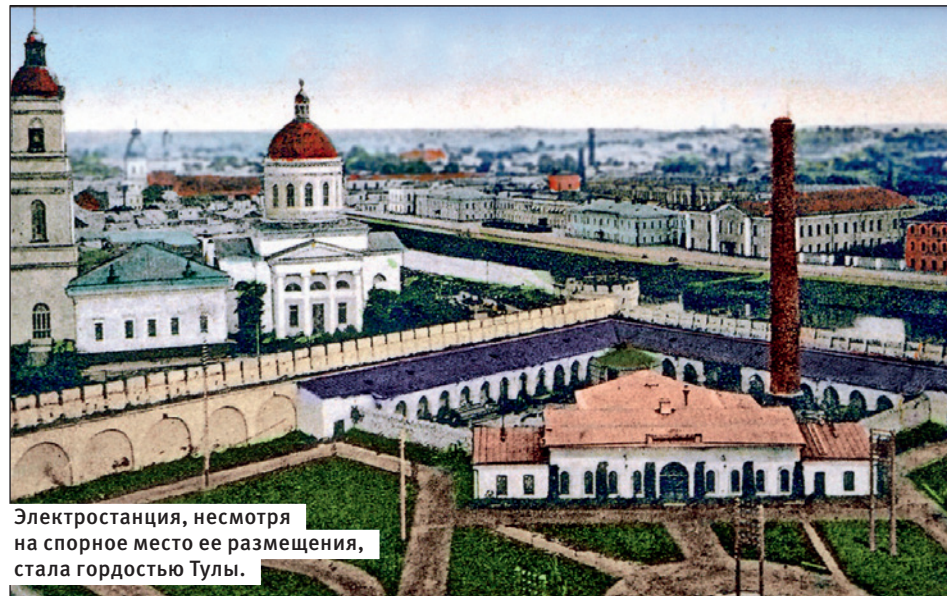
Электростанция, несмотря на спорное место ее размещения, стала гордостью Тулы.