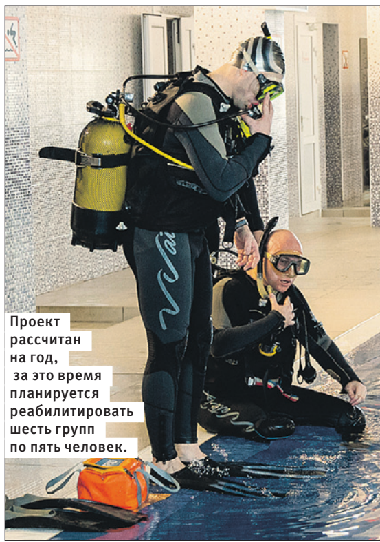
Проект рассчитан на год, за это время планируется реабилитировать шесть групп по пять человек.