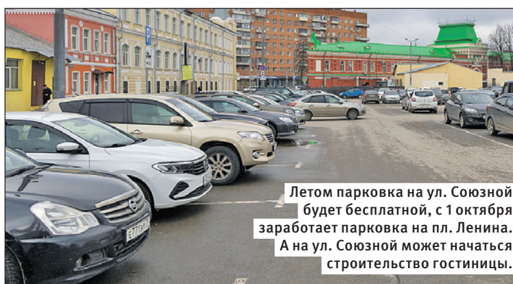
Летом парковка на ул. Союзной будет бесплатной, с 1 октября заработает парковка на пл. Ленина. А на ул. Союзной может начаться строительство гостиницы.