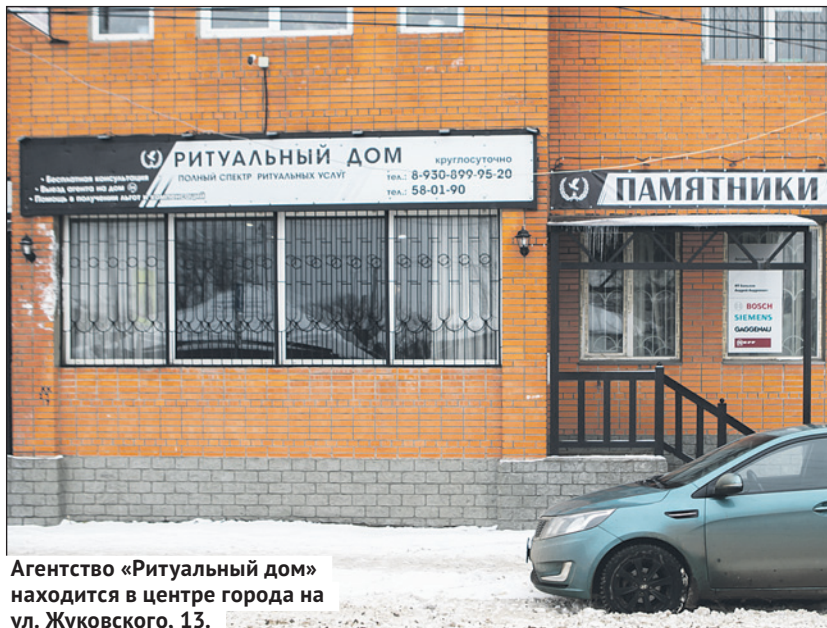
Агентство «Ритуальный дом» находится в центре города на ул. Жуковского, 13.