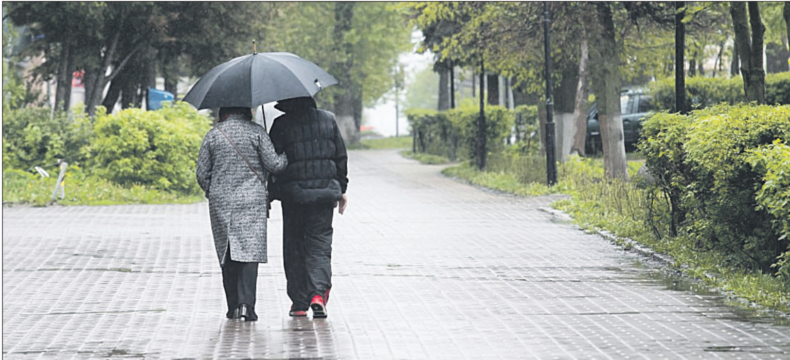
Банк России снизит комиссии для компаний, предоставляющих жилищно-коммунальные услуги и принимающих платежи через систему быстрых платежей (СБП).

С этой даты в России ужесточается наказание за государственную измену – вплоть до пожизненного заключения.