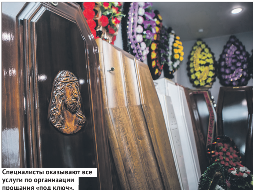
Специалисты оказывают все услуги по организации прощания «под ключ».