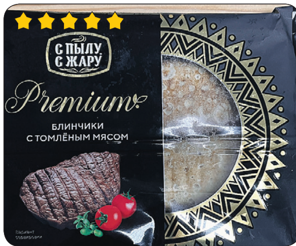
«С пылу с жару Premium»