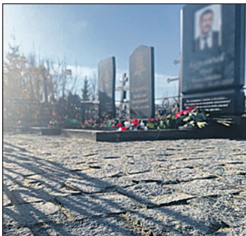
При желании можно благоустроить могилу брусчаткой.

Юлия Александрова.