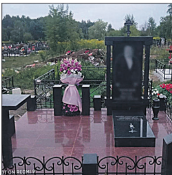
Один из вариантов благоустройства, выполненный «под ключ» «Ритуальным домом».