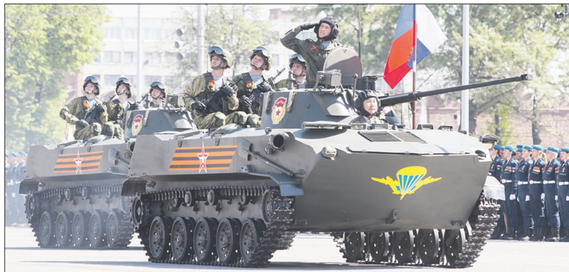
Парад Победы по традиции начинается в 10.00.