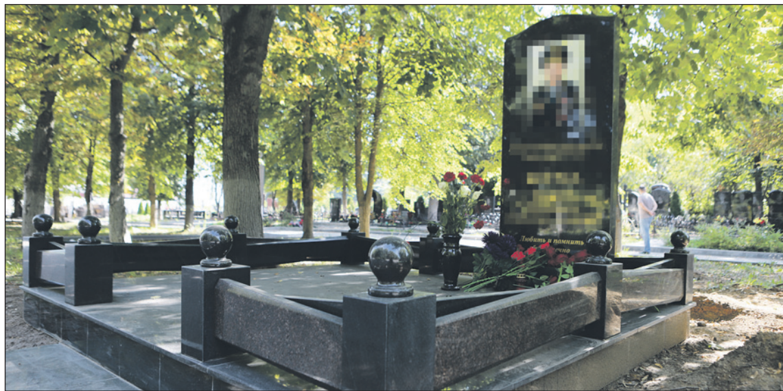
Лазерная гравировка позволяет нанести на памятник из габбро-диабаз любое изображение.

На выбор предлагается два варианта благоустройства: плиткой или брусчаткой. Кстати, если территория захоронения была благоустроена плиткой, а через несколько лет возникла необходимость дозахоронения, то можно обратиться в «Ритуальный дом». Специалисты аккуратно разберут ту часть, где будет производиться захоронение, а пос-