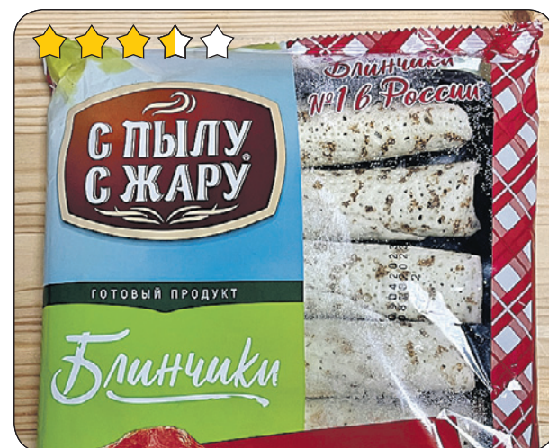
«С пылу с жару»

Начинки много. Мясо не самое вкусное и слегка пересолено. Тесто тоже среднее. Не высший сорт, но в целом неплохо.