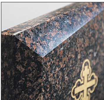
Качество граней отличает работы мастеров «Ритуального дома».