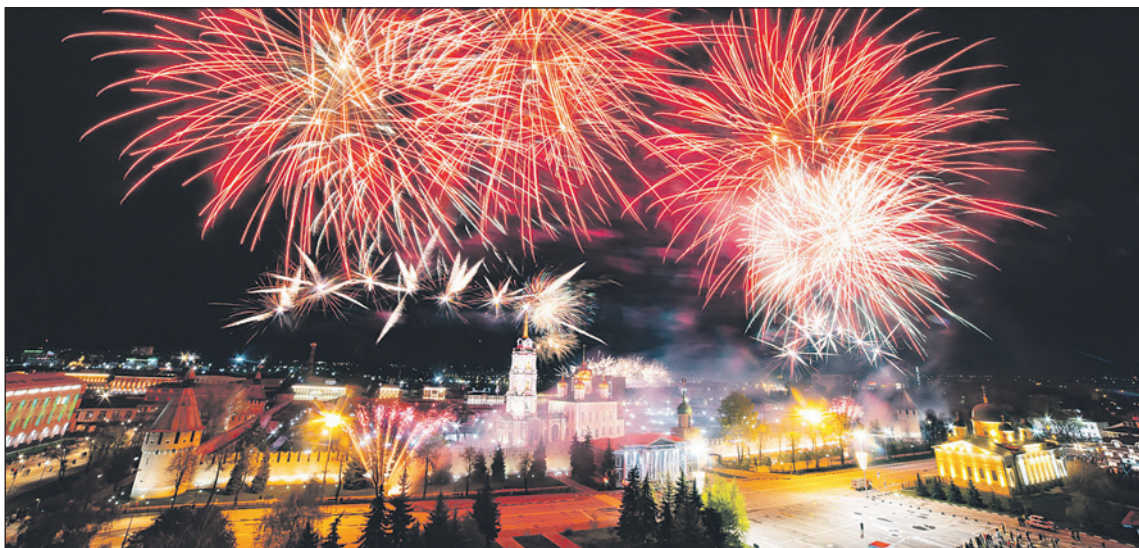
Праздник 9 Мая в городе-герое завершится салютом.