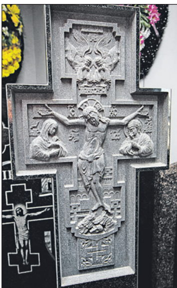
Художественная резьба возможна как фрезерная, так и ручная.