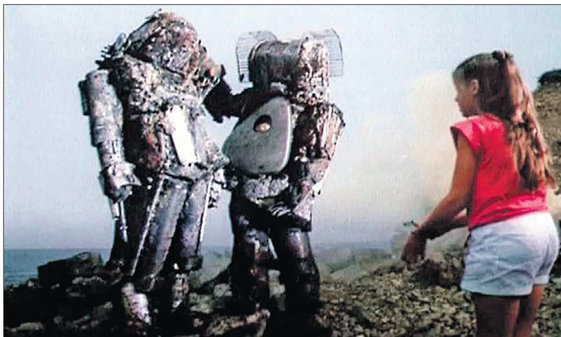
Многие ребята мечтали о таких же опасных приключениях, которые выпали на долю культового персонажа – Алисы Селезневой. Фильм «Остров ржавого генерала», 1988 г.

в одноклассников пластилином или бузиной.