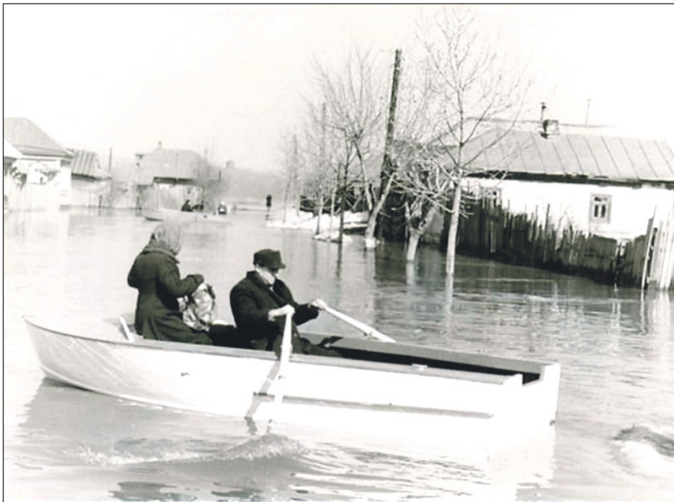
Наводнение 1970 г. За продуктами.