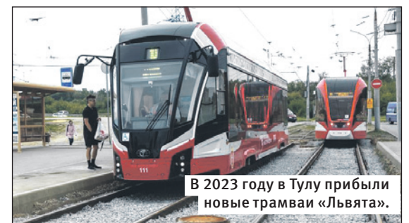
В 2023 году в Тулу прибыли новые трамваи «Львята».