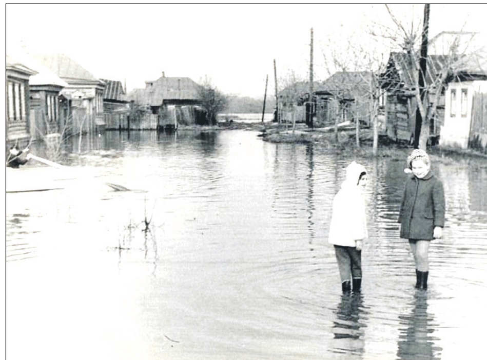
Ул. Хомутовская. 1970 г.

весла в воду, которые при всеобщем старании так и не удалось поймать. Хорошо еще, что на дне лодки оказались доски, которыми немедленно воспользовались вместо весел. Общими усилиями путешественники начали продвигать лодку вперед и наконец достигли одного из островов, где сделали вылазку.