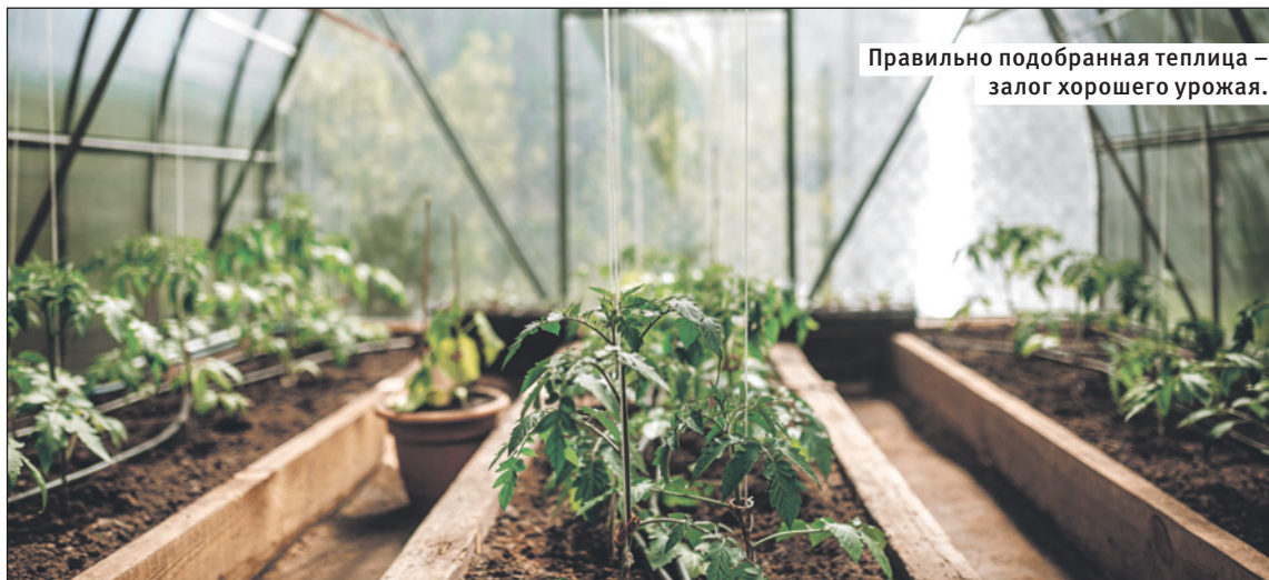
Правильно подобранная теплица – залог хорошего урожая.