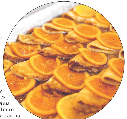
Блинчики «Креп Сюзетт».

Яйца, молоко и сахар взбалтываем до пены. Добавляем дрожжи, снова взбалтываем. Затем вводим муку, а потом соль. Тесто должно быть жидким, как на блины, а не на оладьи – имейте