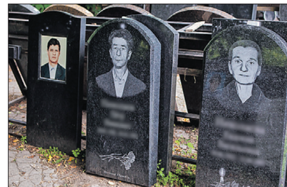
Служба «ПАМЯТЬ» возьмет на себя все хлопоты.