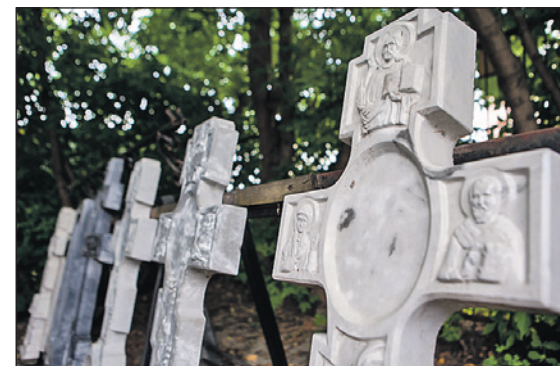
Цены на памятники позволяют сдерживать прямые поставки из Карелии и собственное производство.