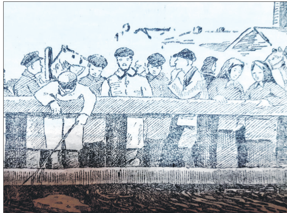
Наблюдение за Упой с моста оружейного завода. 1926 г. Рисунок из газеты «Коммунар».