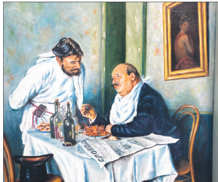
Свободная копия картины художника Владимира Маковского «В трактире». Только на столе у посетителя – выпуск газеты «Слобода».

– Очень многое раздал друзьям, на работе висят мои картины. Мне мое хобби приносит удовлетворение, но только когда картина получается. Это происходит не всегда. Иногда и ругаюсь на себя (смеется). Самое главное – не останавливаться! Многие начинают заниматься творчеством, но по какой-то причине быстро бросают. Не надо! На хобби надо находить и силы, и время.