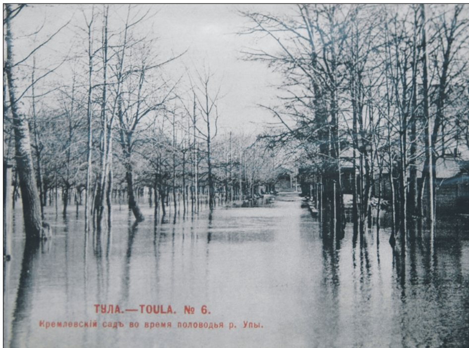
Кремлевский сад во время половодья. Начало XX в.