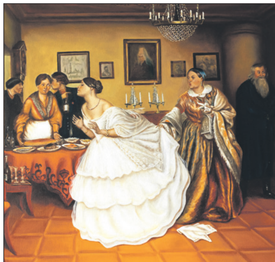
«Сватовство майора». Художник Павел Федотов.