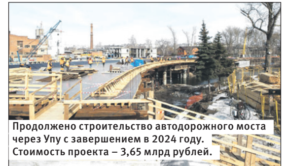
Продолжено строительство автодорожного моста через Упу с завершением в 2024 году. Стоимость проекта – 3,65 млрд рублей.

Перед администрацией стоят задачи, направленные на развитие Тулы и улучшение качества жизни туляков. Определено 8 целей развития экономики, реализация которых позволит вывести Тулу на новый уровень, расширить ее преимущества перед другими городами и сделать проживание здесь комфортным.