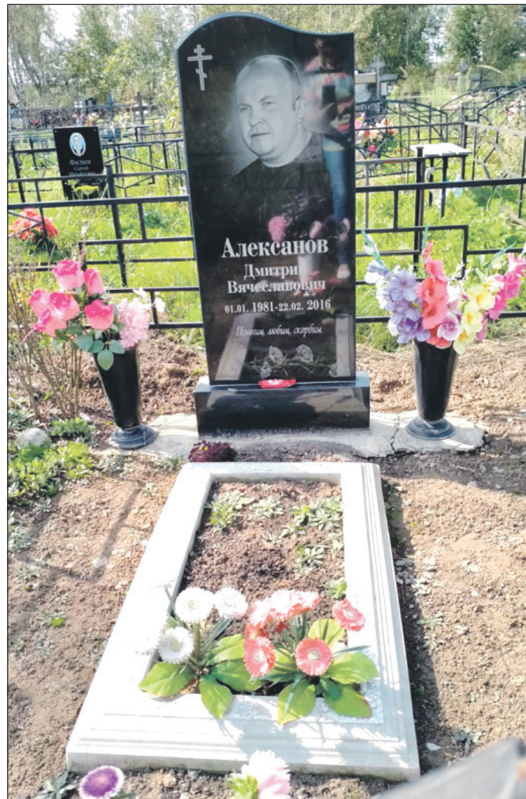
Официально: убийца туляка до сих пор не найден, дело приостановлено.