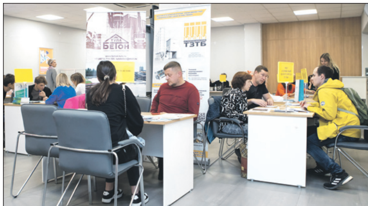
Все вакансии, которые заявляют работодатели, размещаются на Единой цифровой платформе «Работа в России».

– Правительство региона разработало программу «Работа в Туле», она акцентирует внимание на вопросах подготовки, привлечения и удержания кадров. Последнее – очень важно. Мы будем составлять рейтинг