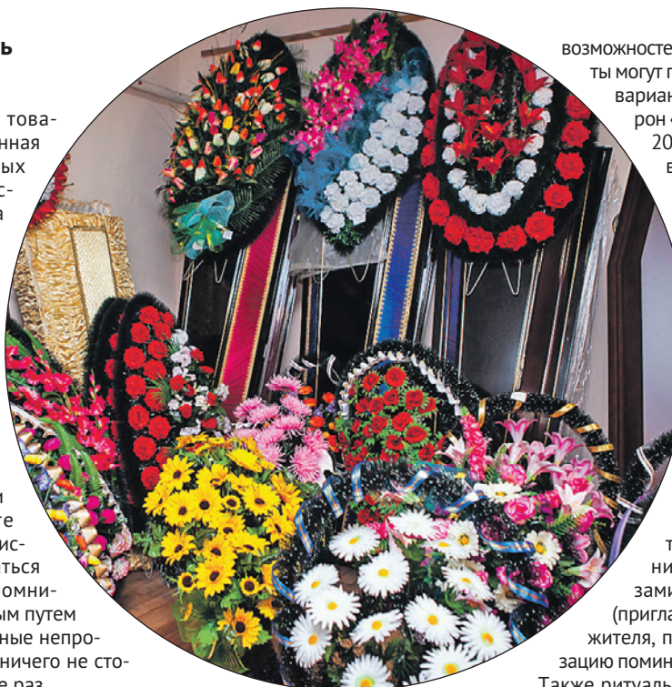
В ритуальной службе «ПАМЯТЬ» есть собственное производство ритуальной атрибутики.

Не поддавайтесь панике. Конечно, в первые минуты вы не знаете, за что хвататься, куда звонить. Спокойно! У вас достаточно времени, чтобы немного остыть, а потом размеренно заняться организацией похорон. Почитайте отзывы в интернете, посмотрите, что пишут в СМИ, ознакомьтесь с каталогом и примите взвешенное решение.