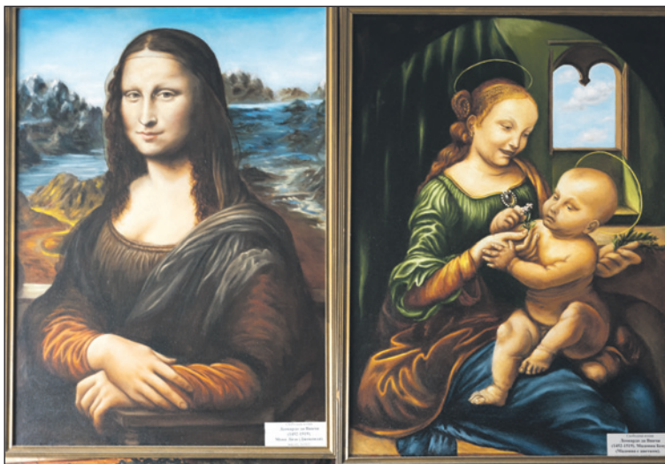
«Мона Лиза» и «Мадонна Бенуа». Леонардо да Винчи.