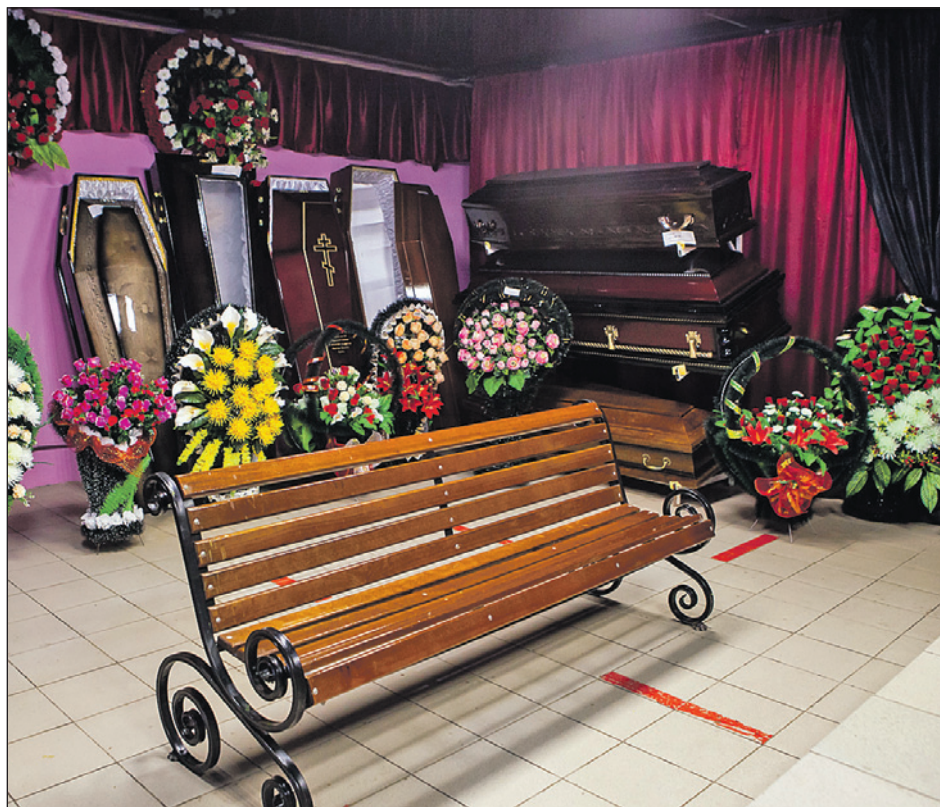
У ритуальной службы «ПАМЯТЬ» есть собственный траурный зал.

Выбирайте ритуальную службу, которую давно знают в городе, и не стесняйтесь позвонить и уточнить, есть ли в организации агент с таким именем, которым представился пришедший в дом специалист. Это не стыдно, но может предостеречь от проблем и сэкономить деньги.